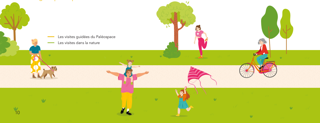
— Les visites guidées du Paléospace — Les visites dans la nature

→ Paléospace | Horaire : 14h | Durée : 1h30 | Tarifs : 9,90€ / adulte et 7,90€ / réduit | Infos et réservations en ligne : paleospace-villers.fr