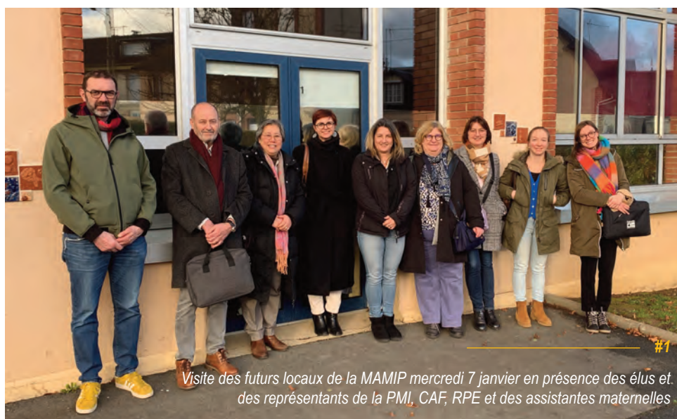
Visite des futurs locaux de la MAMIP mercredi 7 janvier en présence des élus et des représentants de la PMI, CAF, RPE et des assistantes maternelles.

Un remerciement particulier aux acteurs qui ont accompagné ce projet et sans lesquels il n'aurait pas pu se concrétiser : la PMI, la CAF, le Relais Petite Enfance et l'association des assistants maternels.