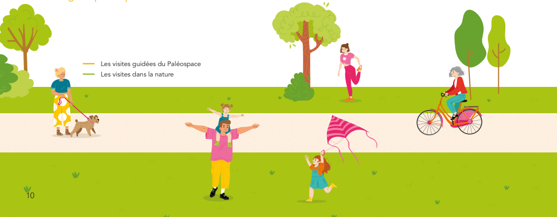
— Les visites guidées du Paléospace — Les visites dans la nature

→ Paléospace | Horaire : 14h | Durée : 1h30 | Tarifs : 9,90€ / adulte et 7,90€ / réduit | Infos et réservations en ligne : paleospace-villers.fr